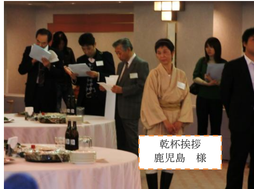
乾杯挨拶 鹿兒島 様